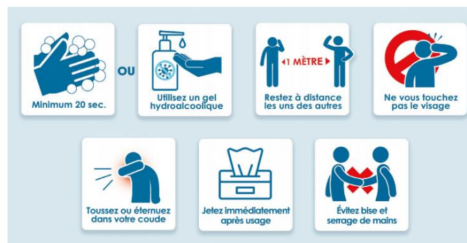
Image n°1 : les gestes barrières, crise sanitaire Covid-19, Nouvelle-Calédonie, avril 2020

Les gestes barrières doivent être respectés en toutes circonstances et quel que soit le stade de l'épidémie. .