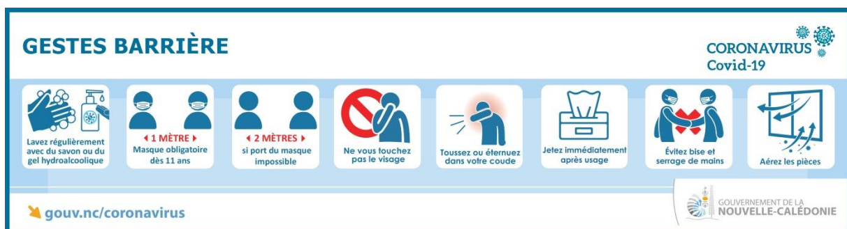
Tableau de bord de la crise : https://georep.nc/carto-thematique/sante-securite-et-civisme/covid-19

Point vaccinal : https://gouv.nc/vaccination