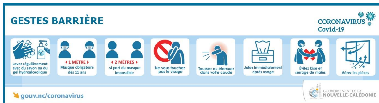
Tableau de bord de la crise : https://georep.nc/carto-thematique/sante-securite-et-civisme/covid-19

Point vaccinal : https://gouv.nc/vaccination