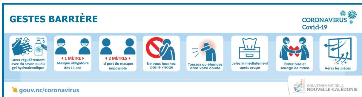
Tableau de bord de la crise : https://georep.nc/carto-thematique/sante-securite-et-civisme/covid-19

Point vaccinal : https://gouv.nc/vaccination